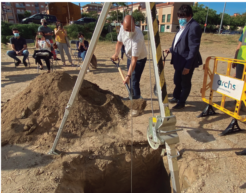
Moment de la col·locació de la primera pedra el passat mes de juliol.

El projecte preveu la construcció d'un edifici plurifamiliar per a 46 habitatges, 26 places d'aparcament de cotxe i tres places d'aparcament de motocicleta, distribuïts en planta baixa, cinc plantes més, planta coberta i una planta soterrània per als aparcaments. La construcció es farà en el terreny del carrer de Roger de Flor amb Isaac Albéniz. Aquesta promoció es va formalitzar en el marc del Programa de la Diputació de Barcelona de suport als municipis en la promoció d'habitatge protegit, que té com a objectiu la concertació de promocions d'habitatges amb protecció oficial (HPO) entre ajuntaments i promotors privats a través del Registre d'Entitats Promotores d'Habitatge Protegit (REPHP), titularitat de la Diputació.