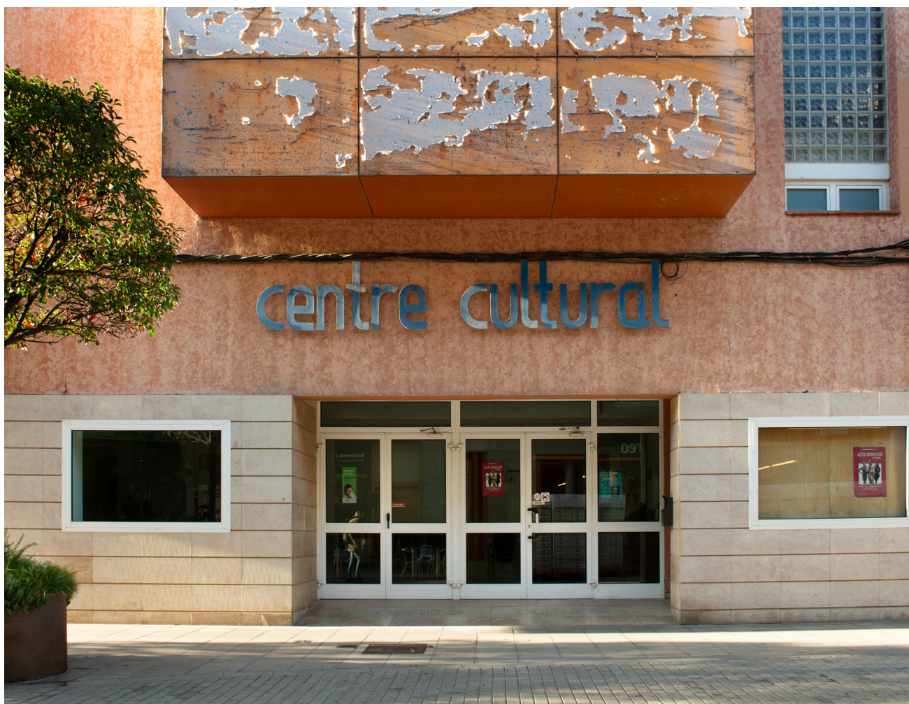
Façana de l'actual Centre Cultural.

lau, Escola Municipal d'Adults Cases dels Mestres van participar en el procés de participació. L'estudi de programació recull la necessitat de crear un nou espai escènic a Malgrat de Mar, ja que l'actual Centre Cultural -que aquest any serà reformat- ha quedat obsolet, amb un aforament insuficient i unes instal·lacions poc versàtils. Les opinions recollides expressen la voluntat que el nou teatre sigui un espai d'aprenentatge, d'estímul, de creació de les arts escèniques. També la idea que un cop consolidat pugui convertir-se en un referent a nivell comarcal i pugui entrar en el circuit de programació de la zona. També es demana que el nou equipament tingui un caràcter cultural, però també que sigui un espai de creació i educatiu, oferint activitats de teatre, música, dansa, audiovisual i cinema.