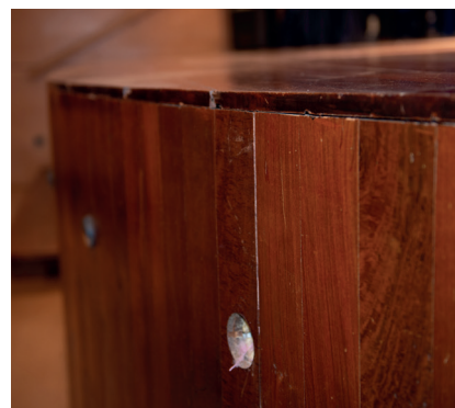
La platea i imatges de detall de l'equipament.